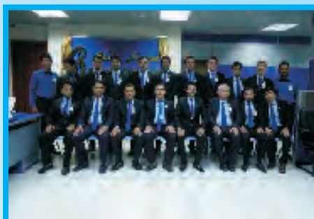
نمایندگی مزار شریف