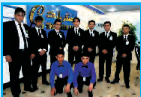
نمایندگی شهر نو