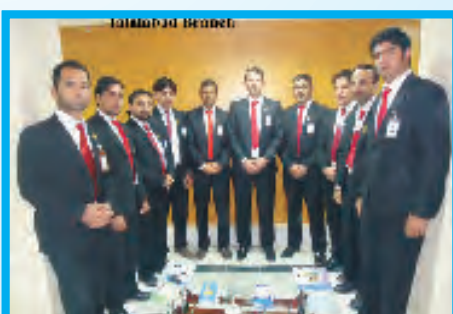
نمایندگی جلال آباد